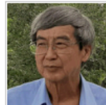
Porn Panosot, Thailand